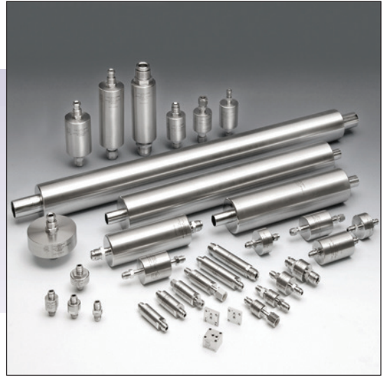
TEM-100是此图中最长的过滤器。